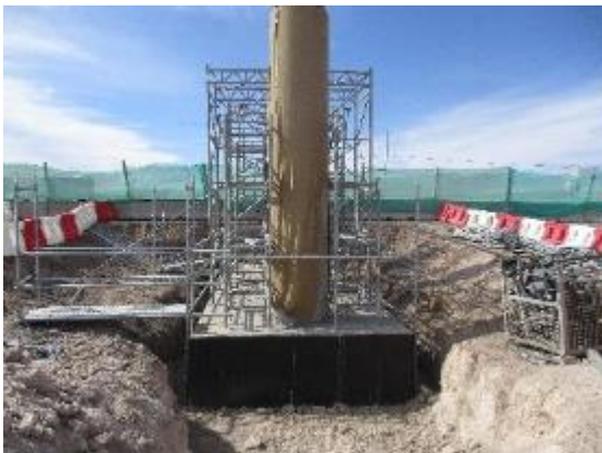
Foto N° 05 Parque Las Industrias